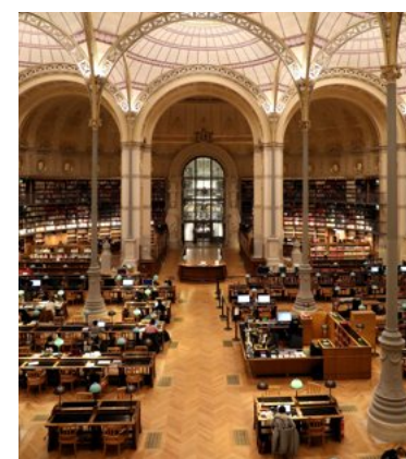
De Labrouste-leeszaal.

De locatie raakte in 1998 in onbruik nadat in 1995 de nieuwe hoofdzetel van de BnF in het zuiden van Parijs, aan de Seine, openging. Die très grande bibliothèque (TGB) werd op vraag van president François Mitterrand ontworpen door architect Dominique Perrault. (red)